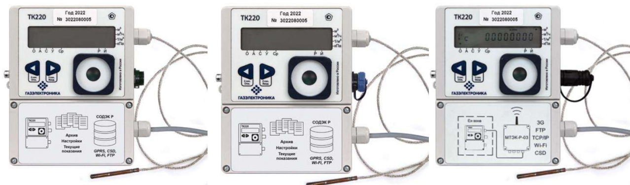
Рисунок 1 – Общий вид основных исполнений корректора