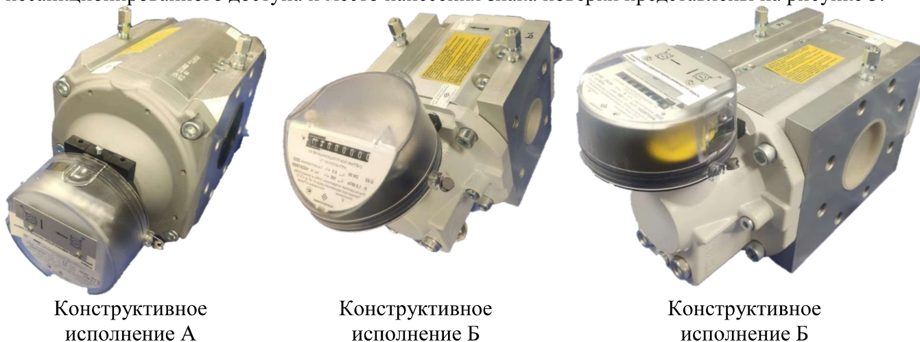
Рисунок 1 – Общий вид основных исполнений счетчиков

Общий вид основных исполнений счетчика представлен на рисунке 1. Пломбировку от несанкционированного доступа осуществляют с помощью проволоки и свинцовой (пластмассовой) пломбы с нанесением знака поверки давлением на пломбы, пломбировка изготовителя производится с помощью разрушаемых стикеров. Заводской номер в виде цифрового кода наносится на циферблат отсчетного механизма одним из следующих методов: методом термопечати, гравировки или нанесением краски. Места нанесения заводского номера и знака утверждения типа представлены на рисунке 2. Схема пломбировки от несанкционированного доступа и место нанесения знака поверки представлены на рисунке 3.